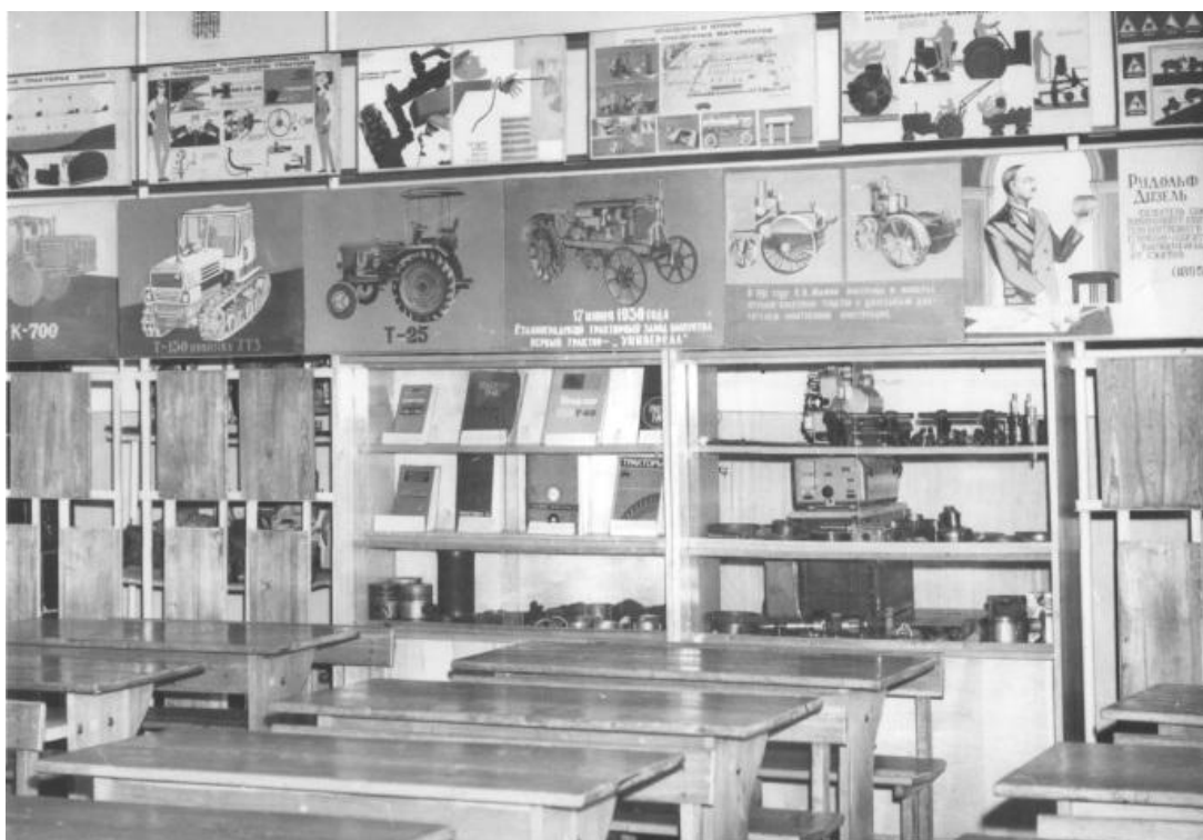
Учебный кабинет «Тракторы». Заведующая кабинетом Турло Н.А.