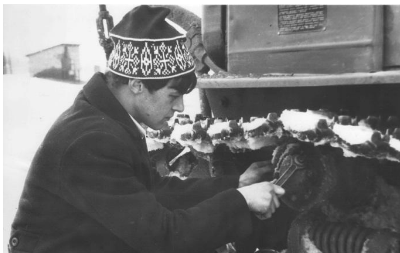
Практические занятия. Обслуживание ходовой части гусеничного трактора