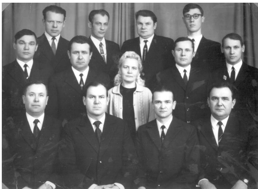
Коллектив педагогов СПТУ-2. 1978

В 1963 году был только один двухэтажный корпус училища.