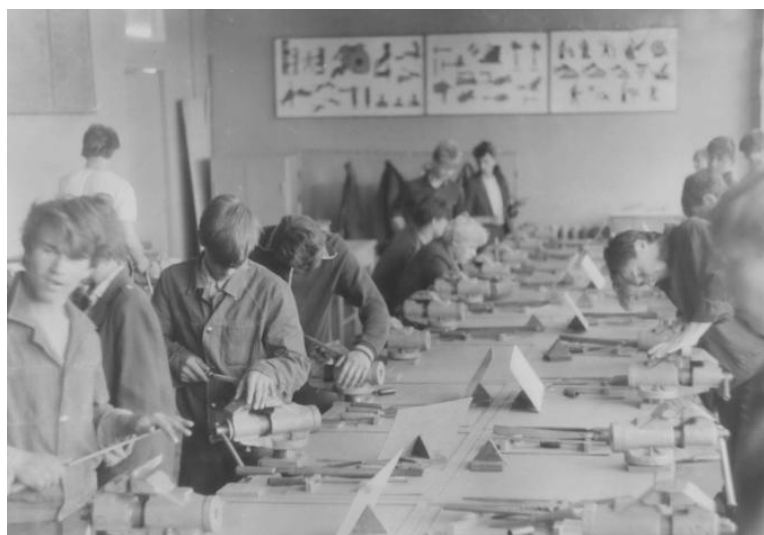
Практические занятия в кабинете «Слесарная обработка металлов»