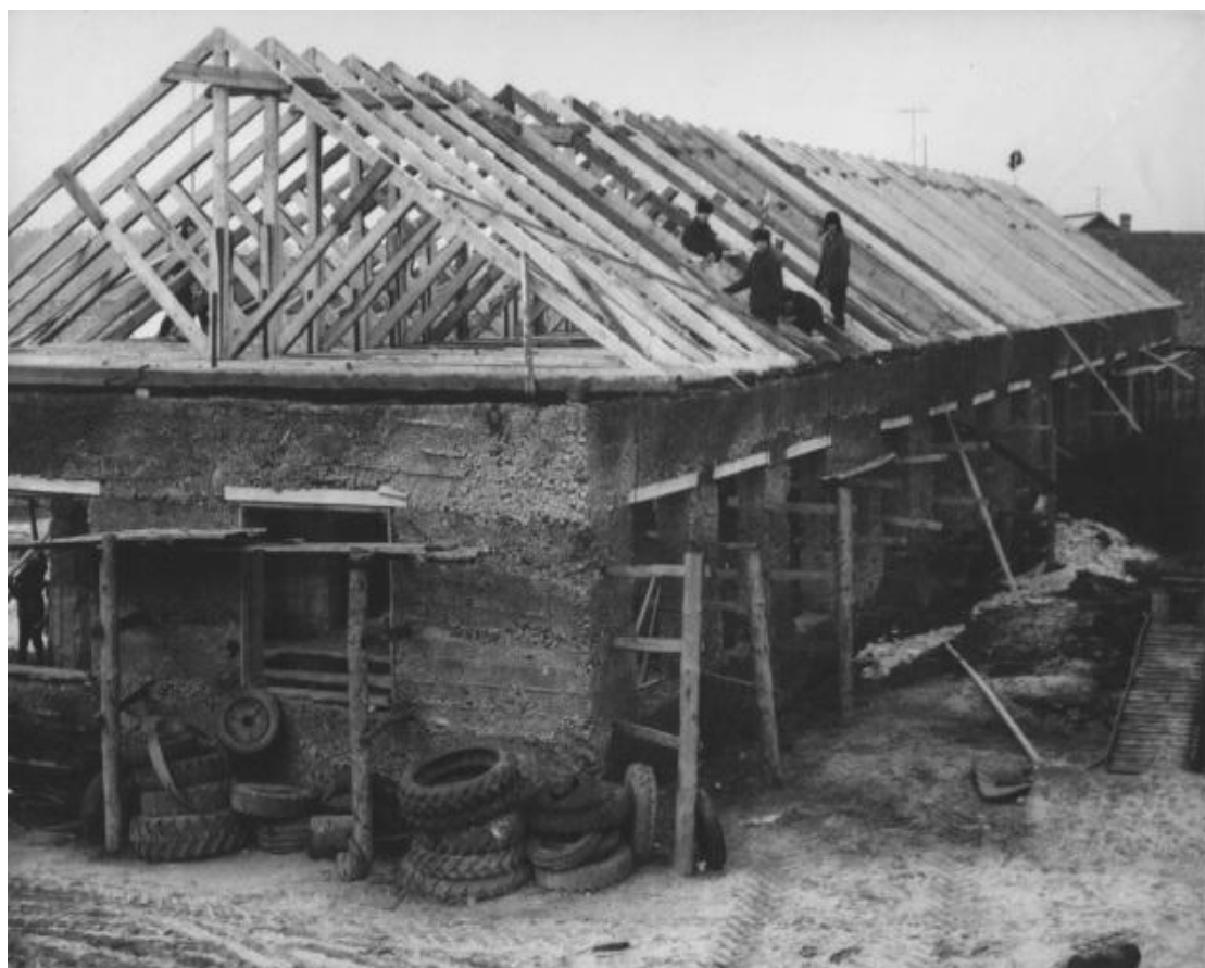
Строительство учебного корпуса «Автомобили» силами работников и учащихся училища. 1976